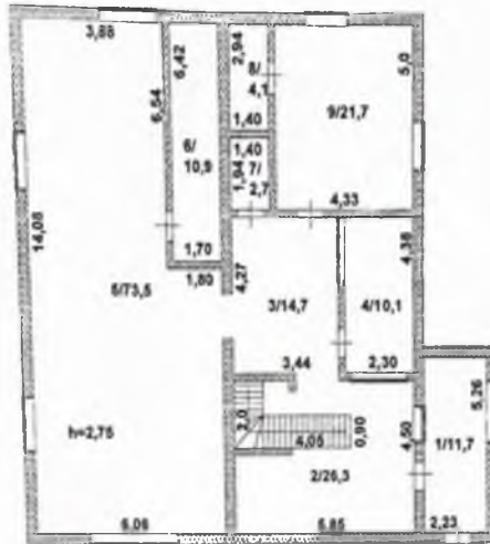
план 1 - го этажа