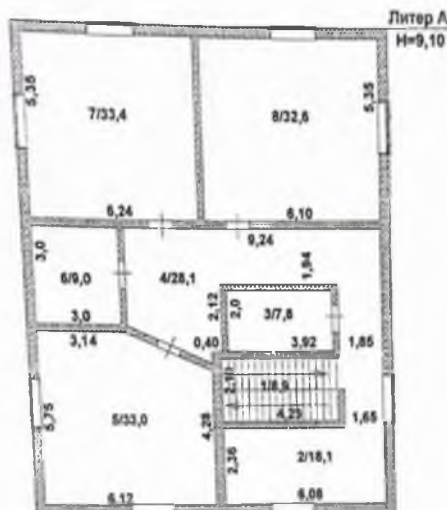
план 3 - го этажа